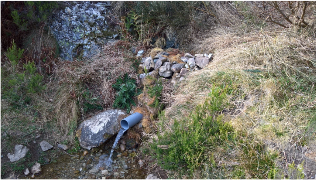
Manantial de Cabriles o Fuente del Prao del Tío Vitor despues de la "reforma" realizada en septiembre de 2017. En la versión impresa del libro se espapó la errata de fechar esta reforma en septiembre de 2019.