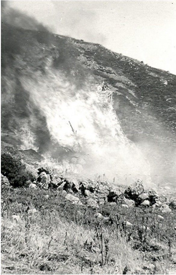
Incendio del Chozo de Cabriles en agosto de 1961.