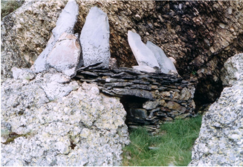
Chozo de Postil de Soña en la actualidad. Fotografías de Verónica García Lucas.