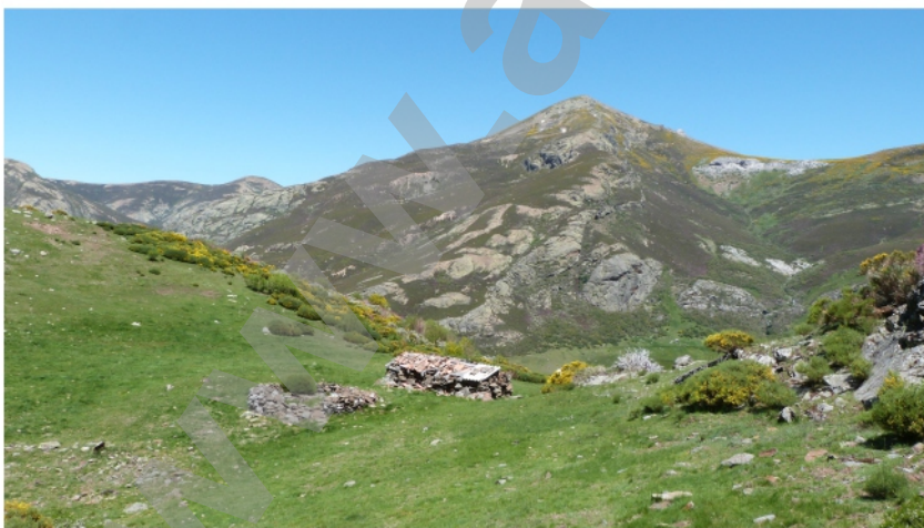
Distintas vistas del Chozo Cimero del Hospital en la década de 2010. Se puede observar el círculo de piedras del chozo de tejado de paja en el que pasaron su última noche los "Faquires" en día 15 de abril de 1957.