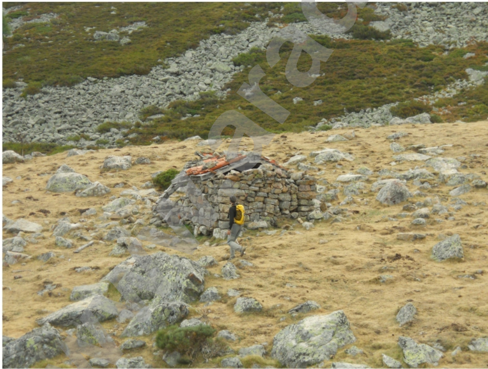
Chozo de Bernabé en septiembre de 2012.