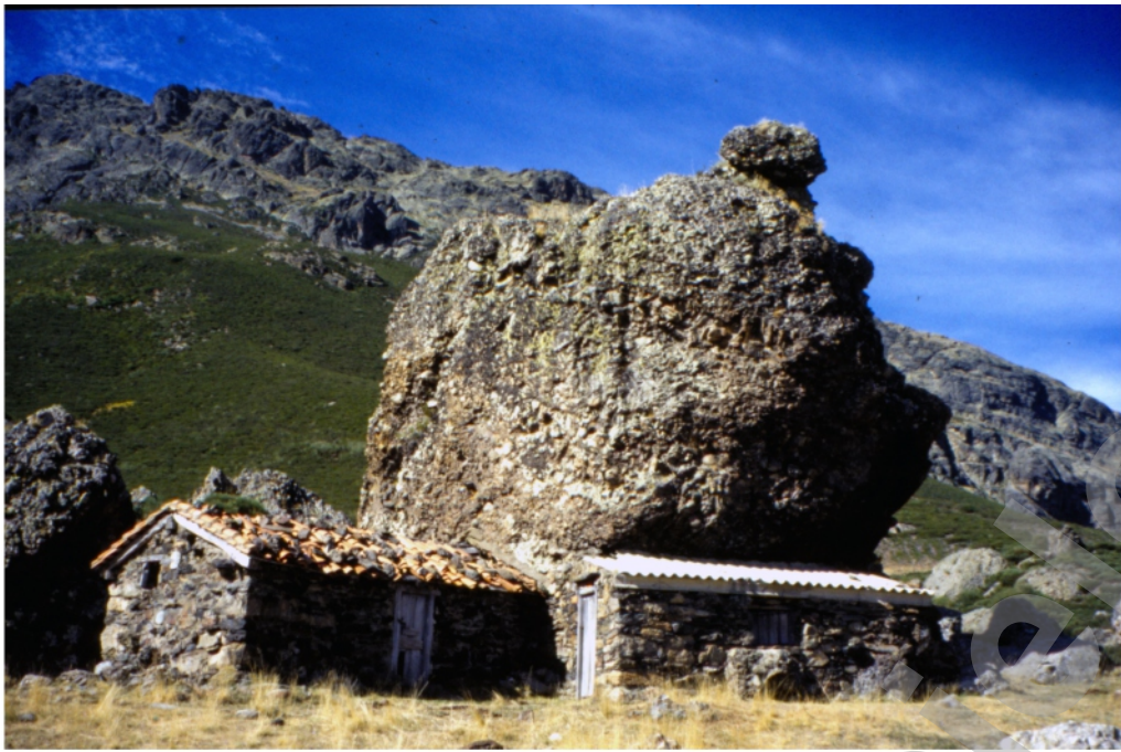
Cozo Bajero del Hospital en los años 80.