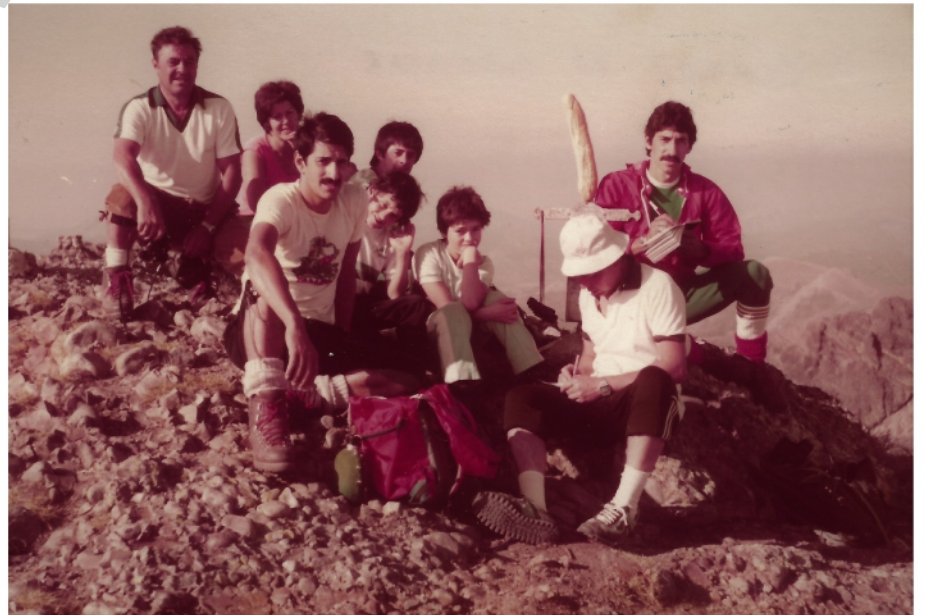
Un grupo de montañeros palentinos junto a la Cruz en julio de 1979.