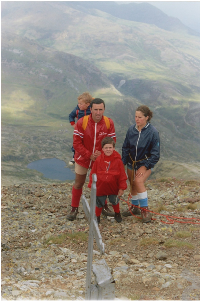
La familia Pollos al completo y un grupo de amigos el día 13 de mayo de 1990. La Cruz sigue intacta.